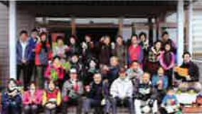
健康ウォーキング大会