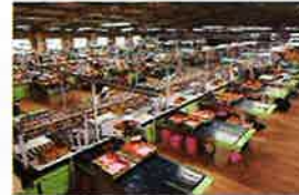
低コスト耐接性ハウスの導入 生産基盤強化