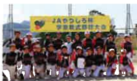
食農教育学童野球大会

食農教育活動や生活支援活動を通じて地域のニーズを捉え、地域の方々が喜ばれ、なくてはならないJAを目指しています。JAやつしろは、地域活性化の一役を担います!!