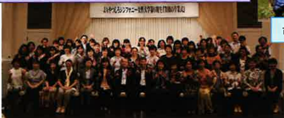
市民農園の取組み