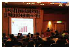
マイチャレンジ (販売担当の成果発表)