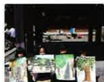
子供スケッチ大会